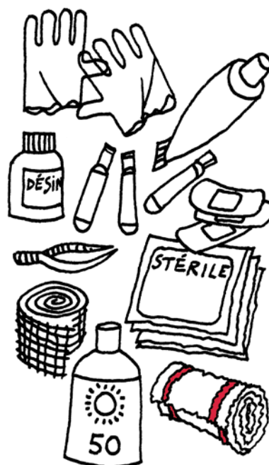
Contenu-type de la trousse de soins ou « de secours »