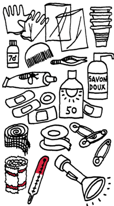
Contenu-type de la boîte de soins à avoir sur place

Le rôle de la boîte de soins n'est évidemment pas destinée à se substituer au médecin ni au pharmacien.