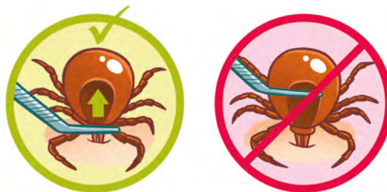
Ôter la tique en plaçant la pince au niveau de la tête, sans comprimer le corps